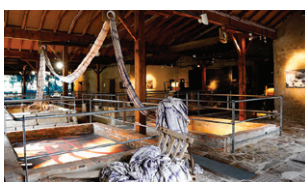
Musée du textile et de la mode