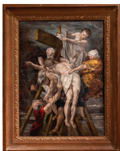
Descente de Croix - vers 1900 Ernest Blancher