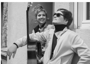
MELKONI PROJECT

Découvrez certaines œuvres de l'exposition « Une vie en Egypte. Périchon-Bey et sa collection », accompagnés de Nelli Vermel, cheffe costumière à l'Opéra. Puis, réalisez votre propre maquette de costume d'inspiration égyptienne à partir de silhouettes dessinées sur papier, à customiser à l'envi.