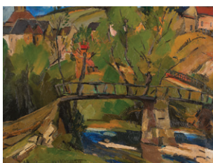
Vieux pont sur la Billardière à Gargillesse d'Anders Osterlind. Association A. Osterlind