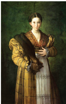
Antea par Francesco Mazzola dit Parmigianino. Musée Capodimonte - Naples.