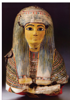
Enveloppe de momie - 3 e période intermédiaire.