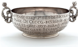
Coupe de baptême