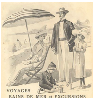
Belle Jardinière - 1912