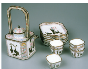
Service à thé cantonnais du BAL