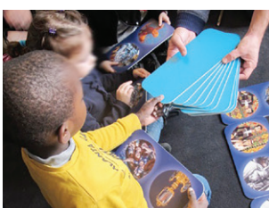
Domino émaux BAL