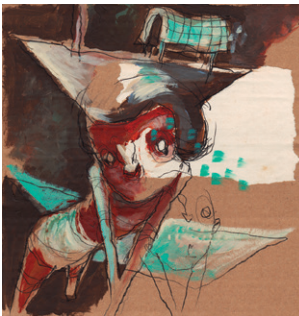
Maîtres de vie