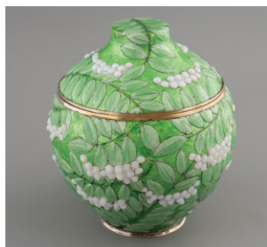
Jules Sarlandie Pot couvert, vers 1920 - BAL

La dernière Commission scientifique régionale d'acquisition (CSRA) qui s'est déroulée à Angoulême en juin a une nouvelle fois validé l'ensemble des dossiers que les responsables de collections du musée lui avaient soumis.