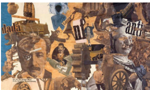
H.Höch, - Cut with the kitchen knife Collage mixed media, 1919-1920 (Nationalgalerie, Staatliche Museen, Berlin)