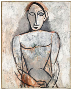
Picasso - Femme aux mains jointes (étude pour Les Femmes d'Alger), huile sur toile - Musée Picasso