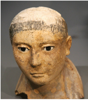
Masque funéraire d'un jeune homme Plâtre peint, IV e siècle ap. J.-C. M.B. A Limoges.