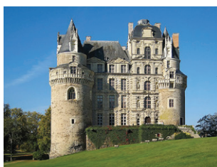
Château de Brissac