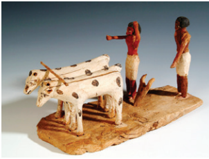
Les laboureurs