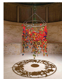
Vue de l'exposition au musée de Rochechouart